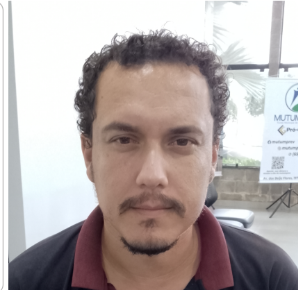
Foto do Segurado