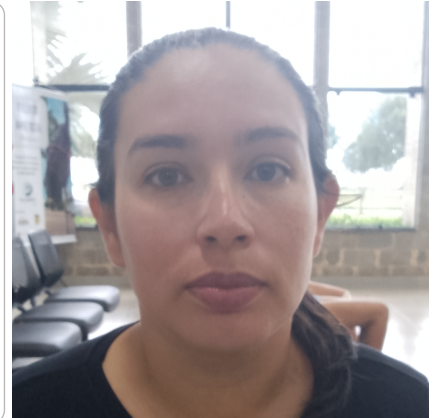
Foto do Segurado